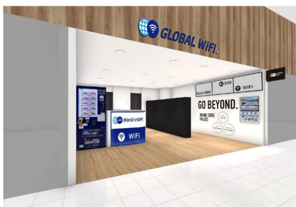
第1ターミナル出発ロビー（4階）南店

関西国際空港第1ターミナルは南北に広く、従来の1店舗体制では目にしていただきづらく、また、チェックイン手続きをされるカウンターによっては長い距離を移動いただく必要がありました。南北の2店舗体制となることでこのような課題が解決できることに加え、今後さらに需要の拡大が見込まれる海外渡航および訪日観光において、より快適な通信関連サービスのご提供ができると考えています。