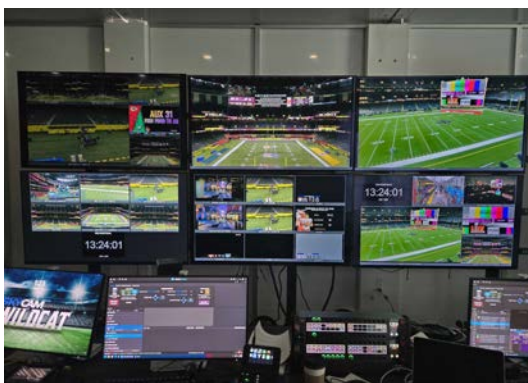
試合中のFOX SportsのARコントロール室の様子