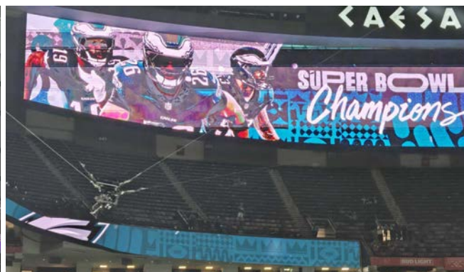
会場で使われたKudan SLAM搭載カメラ