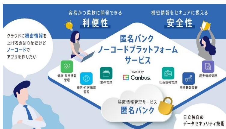
サービスの概要イメージ

本サービスは、システナのノーコードでアプリケーションや基幹システムの開発が可能なプラットフォーム「Canbus. (キャンバスドット)」と日立独自のデータセキュリティ技術でデータを管理するクラウドサービス「匿名バンク」を組み合わせることで、容易かつ柔軟にアプリケーションを開発できる利便性と、個人情報などの機密情報をセキュアに扱える安全性を実現します。従来、情報漏えいなどのリスクからクラウドでは扱いにくかった機密情報もセキュアに管理でき、より多くの業務に適したアプリケーションの開発が容易となるため、企業の業務効率化とDXの推進に貢献します。本サービスは日立より2025年1月29日から販売開始予定です。