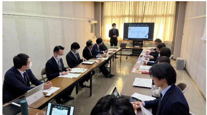
プレゼンの様子（左奥が矢吹町長）

■ 福島県矢吹町プレスリリース： https://prtimes.jp/main/html/rd/p/000000002.000142719.html