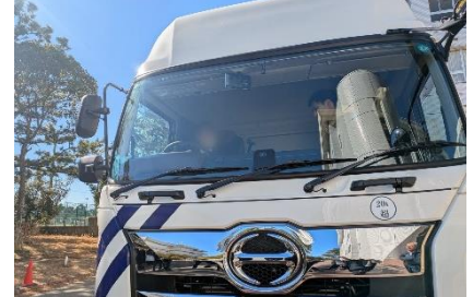
▲20tトラック乗車体験（運輸業）