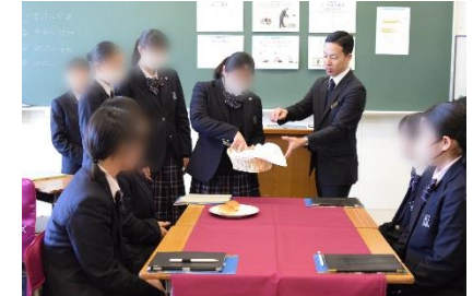
▲パンの盛り付け体験（宿泊業）