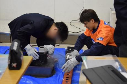
▲鉄の加工体験（製造業）

当日は、様々な業種の企業が参加し、自社の強みである事業内容を、実際に使用している道具や設備を活用した体験を交えながら、生徒にとって理解しやすいよう工夫を凝らして説明を行っていました。