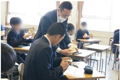
▲お金を数える体験（金融業）