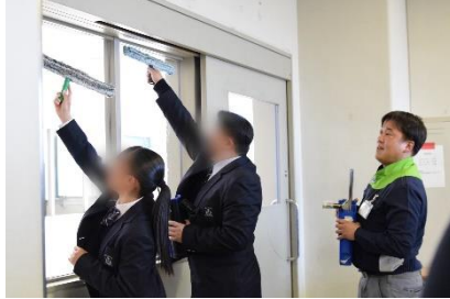
▲窓ふき体験（ビルメンテナンス業）