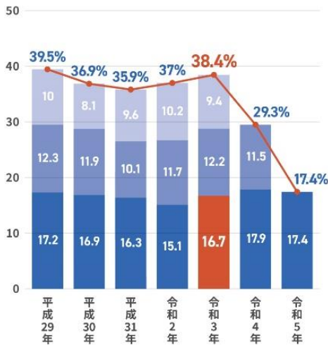
学年別3年以内離職率 / 高卒