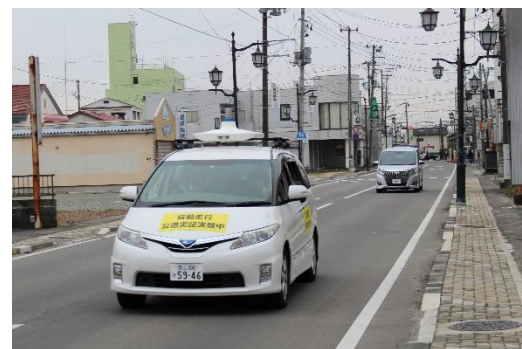
公道での自動走行の様子

本実証試験は、今後も毎週火曜日、第一木曜日、第三木曜日の14：00～16：00の間、最大2往復程度の運行を実施予定です。「自動化」に向けた取り組みのため、道路交通法に基づき、運転席にドライバーが座り、必要な安全対策を行いながらの走行となります。車体には「自動走行 公道実証実験中」の表示を行います。